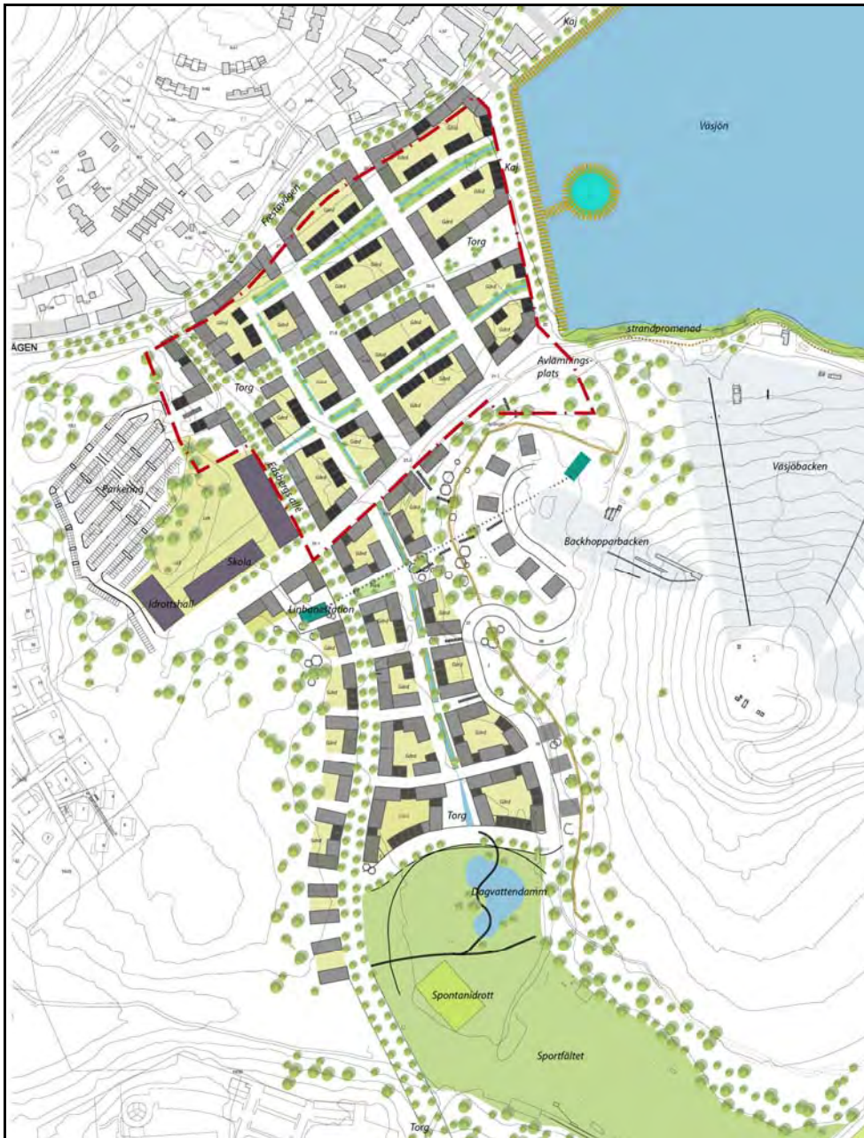
En småskaligare indelning av kvarteren med en blandning av flerbostadshus och stadsradhus

De stråk, som i underliggande detaljplan, är planlagda som mark för bostadsändamål och som får byggas över/ under med planterbart bjälklag avses att nyttjas som kvartersgator och som planterade, öppna dagvattenstråk. De öppna dagvattenstråken syftar till att på ett estetiskt tilltalande och naturligt sätt ta hand om områdets dagvatten så att de reningskrav som finns i underliggande detaljplan kan klaras. Dagvattenstråken kopplas samman med det öppna dagvattenstråk som går från dagvattendammarna på Sportfältet via Södra Väsjön ned mot Mellersta så att en sammanhängande dagvattenstruktur erhålls.