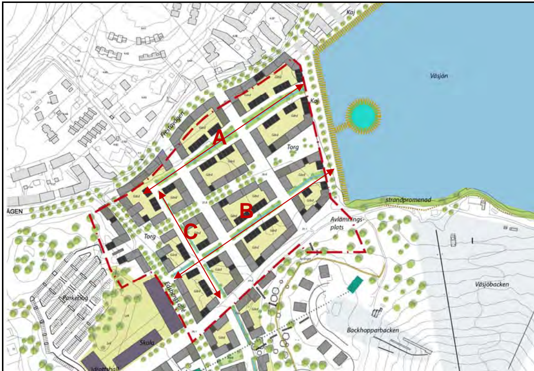
Illustration, visar de kvartersgator där kommunen är fastighetsägare

SEAB ansvarar för utbyggnad och drift av ledningar i form av fjärrvärme, VA, och el till förbindelsepunkt för respektive ledningsslag. Därefter ansvarar fastighetsägaren för utbyggnad och drift av servisledningar och övriga installationer. Gemensamhetsanläggningar kan bli aktuella inom kvartersmark då kvarteren kommer att delas in i flera fastigheter.