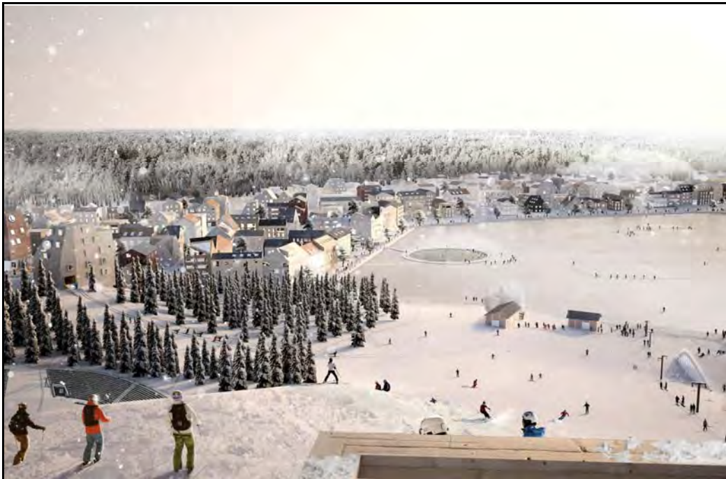
Visionsbild över gestaltningen i Väsjön Mellersta, bild: Dinell Johansson

För att genomföra förslaget på ett ändamålsenligt sätt avses några bestämmelser upphävas och några avses att ändras avseende dess innehåll. Övriga bestämmelser kommer att fortsätta att gälla parallellt med aktuellt tillägg. Ändringar av gällande bestämmelser gäller endast inom tilläggsbestämmeområdet.